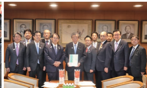
2026年アジア競技大会・パラ競技大会開催へ自民党森山幹事長に全力支援要請!