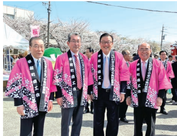
稲沢市へいわさくらまつりに参加