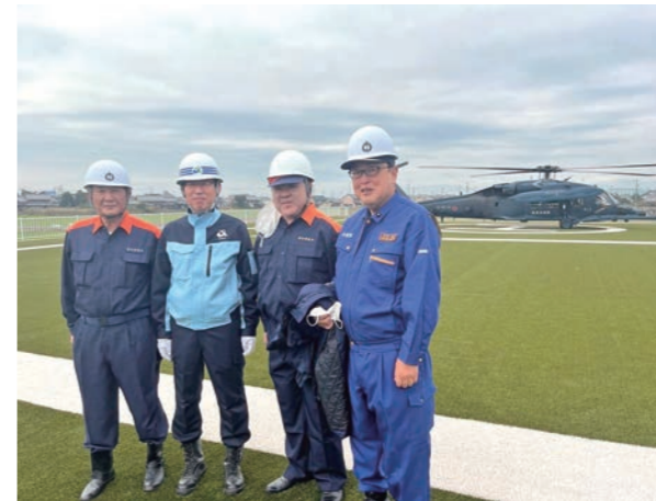
海部地域広域防災拠点での訓練に参加