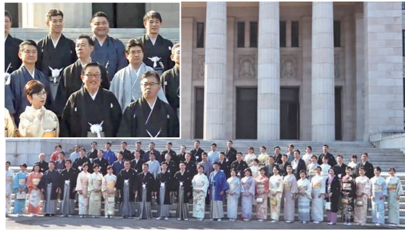
通常国会初日に超党派の和装推進議連として和服で登院