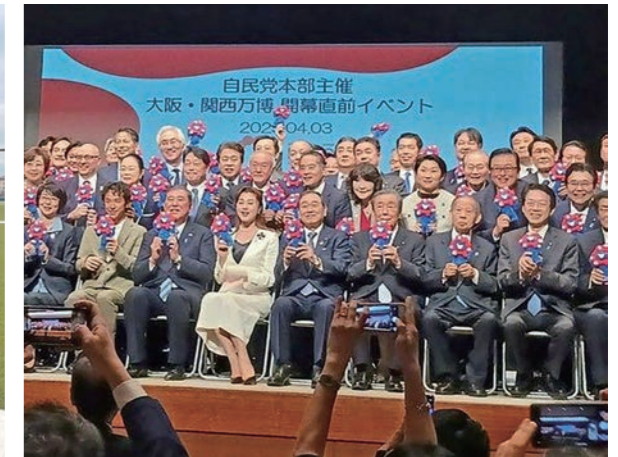
大阪・関西万博の自民党本部での直前イベントに参加