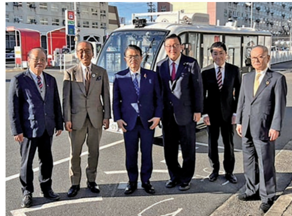
津島市で自動運転の実証実験に参加 (名鉄津島駅⇄津島神社)