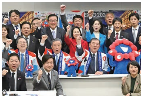
超党派の万博議連