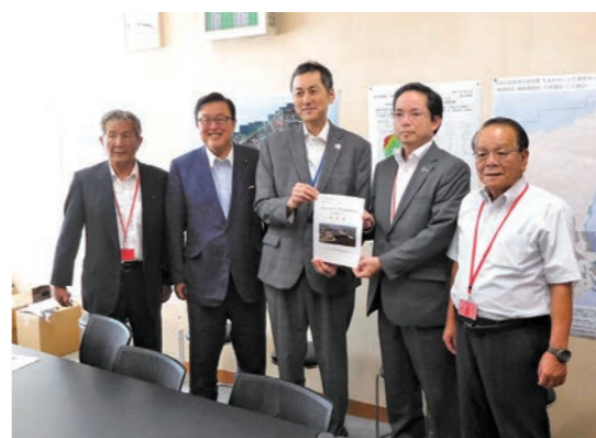
(写真中央) 国土交通省藤巻水管理・国土保全局長、長坂代議士、地元のみなさまと

防災減災対策に 全力!! 大型排水機場を更に一施設増設します 地元の更なる安心安全のため日光川河口の大型排水機場増設計画を推進します。(現在、稼働している大型排水機場二施設の排水能力は東洋一です)