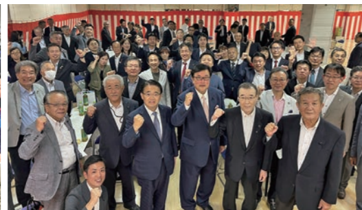
九区公職者会議。地元の県議、市町村長、市町村議員が地元の課題実行に結集!