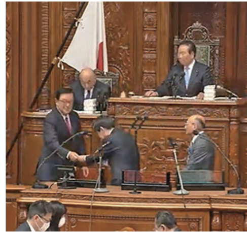
衆議院本会議で記名投票する