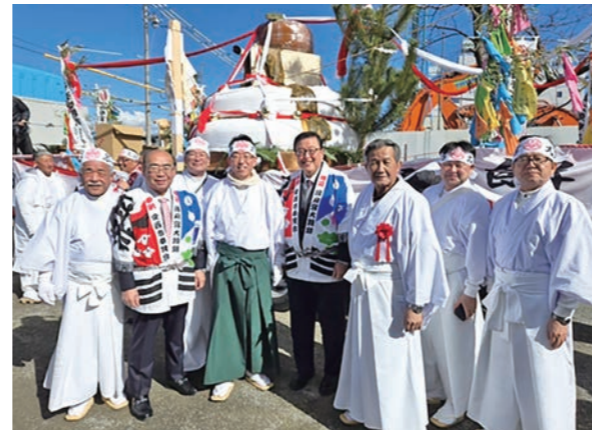
愛西市奉賛会の大鏡餅奉納パレードの 皆様を国府宮で出迎え