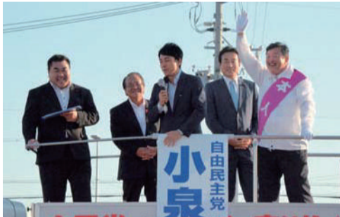
小泉進次郎代議士が長坂やすまさのために来援！（津島市ヨシツヤ本店にて）