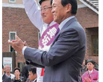
麻生太郎副総理兼財務大臣が来援。（稲沢市の国府宮神社楼門前で）