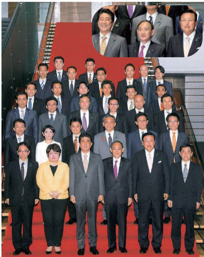
第4次安倍内閣で内閣府と復興庁の大臣政務官に再任され、官邸での記念撮影。

皆様のお陰で3期連続当選!!更にパワーアップ。年頭に決意も新た。エネルギーに平成30年始動!!