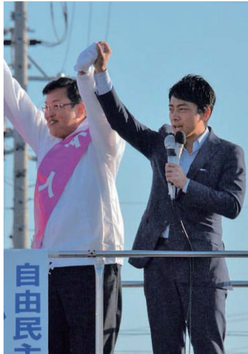
自民党デッキ車の上で小泉進次郎代議士から激励を受ける。