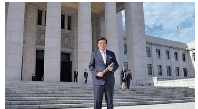
国会に初登院する。(当選後の初登院は国会議事堂の中央玄関から登院する。)