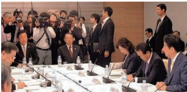
首相官邸大会議室において行われた、国と地方の協議の場で進行役を務める。