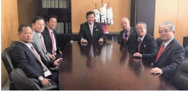
内閣府の長坂大臣政務官室に地元商工会(愛西市、弥富市、あま市、蟹江町・大治町・飛島村、稲沢市の祖父江町、平和町、一宮市の尾西、木曾川)の会長皆様のご来訪。中小企業対策や中小企業の事業承継税制の改善策などの要望をいただき意見交換しました。