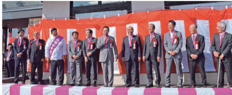
出陣式で九区市町村長（中野市長、久野村長、横江町長、村上町長、村上市長、加藤市長、日比市長、日永市長）さんから激励を受ける。