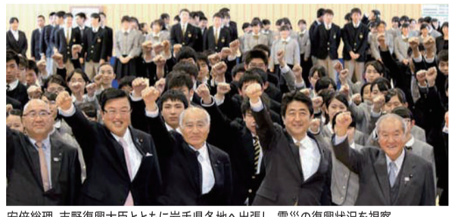
安倍総理、吉野復興大臣とともに若手県各地へ出張し、震災の復興状況を視察。大槌町の若手県立大槌高校にて、全校生徒との記念写真。写真左から大槌町の平野町長、長坂大臣政務官、吉野復興大臣、安倍総理、鈴木オリンピック大臣。