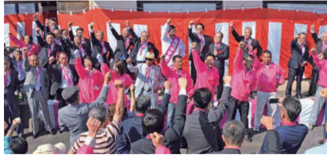
出陣式でご参集の皆さまとガンパローコール。