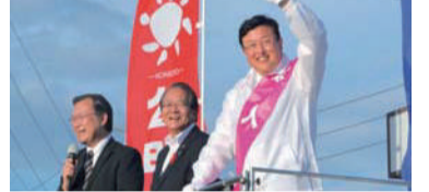
公明党デッキ車の上で木藤県議、中野県議会議長から激励を受ける。