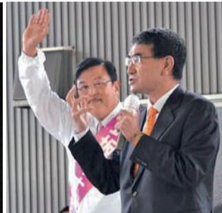
河野太郎外務大臣が来援。（弥富市のJAあいち海部総合支援センターで）