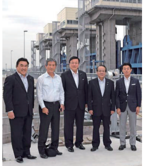
3月に完成する日光川新水閘門を海部津島の同志県議の皆さんと調査。