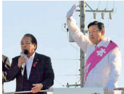
津島市の街頭で中野県議会議長の応援演説。