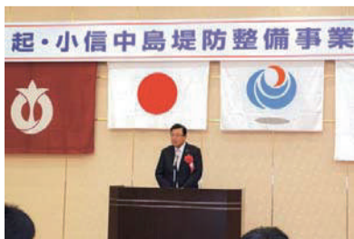
一宮市尾西地区、「起・小信中島堤防整備事業着工式典」でご挨拶。