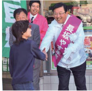
早朝の近鉄蟹江駅での街頭活動。