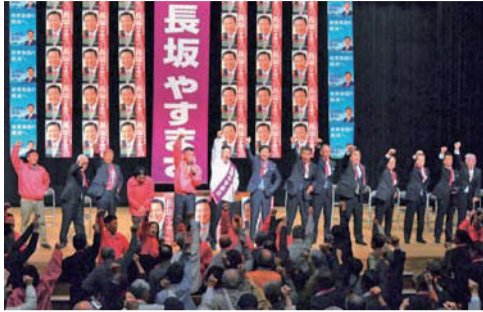
一宮市尾西での総決起大会。