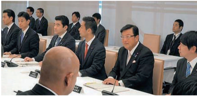
首相官邸大会議室において行われた、大臣政務官会議に出席。