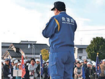
地域の防災訓練でご挨拶する。

地元事務所 〒496-0044 愛知県津島市立込町3丁目26-2 津島ウール会館1F TEL 0567-26-3339 FAX 0567-26-6668 ホームページ http://nagasakayasumasa.mie1.net/