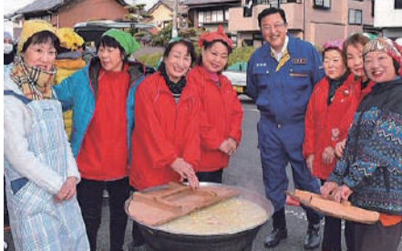
地域の防災訓練でボランティアの皆さんと。