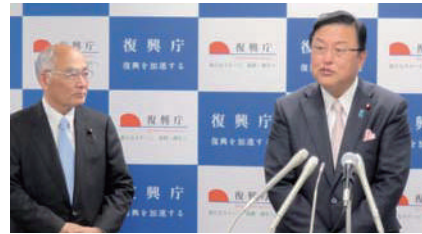
復興庁の記者会見で留任の挨拶。(左は吉野復興大臣)