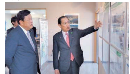
陸前高田市の復興まちづくり情報館で戸羽市長から復興状況の説明を受ける。

あなたの声をお聞かせ下さい! E-mail:jimin_nagasaka@yahoo.co.jp