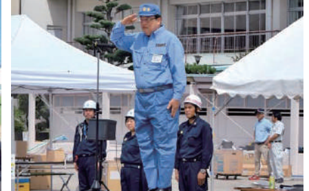
大治町の防災訓練で。