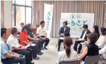
地方創生を担当する内閣府大臣政務官として、宮崎県日南市及び綾町を視察。日南市で現場の皆さんと意見交換。