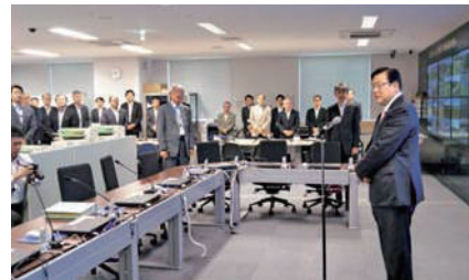
東北地方整備局を訪問し復興事業に取り組む職員を激励。