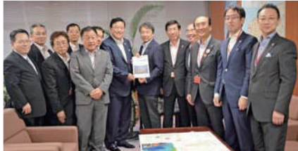
防災面でも必要な宮西港道路の要望を地元市町村長の皆さんと国土交通省に実施。

臣を助け、政策や企画に参 画して、政務を処理するこ とです。大臣を補佐して国 会で答弁を行うほか、重要 な会議に出席して意見を述 べます。