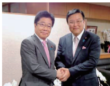
加藤内閣府特命担当大臣(拉致問題担当)と。