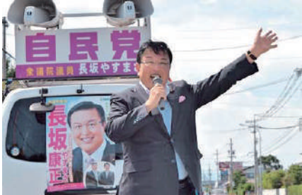
地元の県議、市議と共に街頭活動。