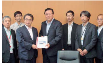
大村秀章愛知県知事から国家戦略特区推進の要望を受ける。