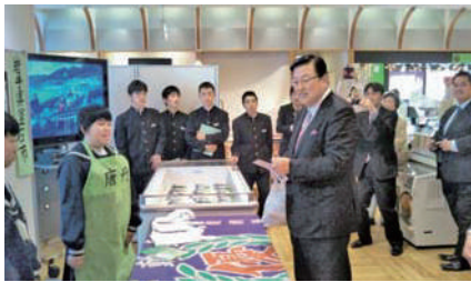
被災地の岩手県アンテナショップで釜石市立唐丹中学校修学旅行生の皆さんと。