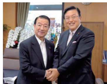
江崎沖縄・北方担当大臣と。