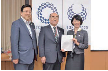
稲沢市の加藤市長と丸川前東京オリパラ担当大臣に要望。