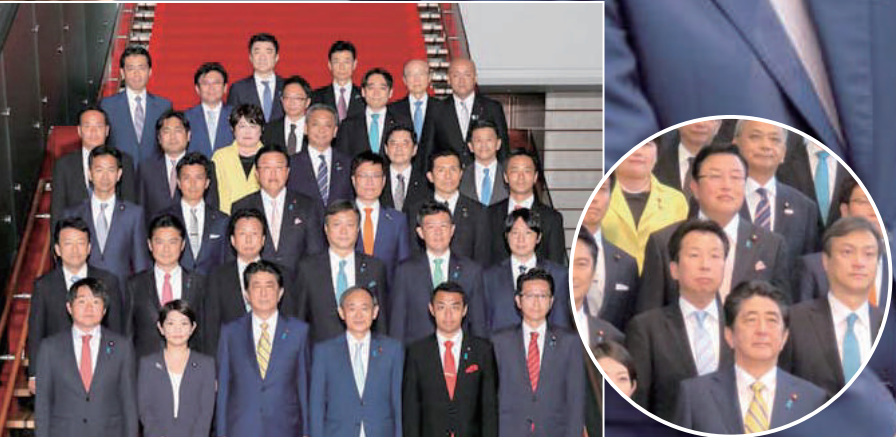
総理大臣官邸において安倍総理を囲んで記念撮影。

地元の課題に全力投球! 内閣府大臣政務官として 地方創生! まち・ひと・しごと創生! 地方分権改革! 規制改革! 新たに拉致問題担当が加わり、 内閣の最重要課題担当で使命に燃える!