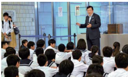
修学旅行中の地元中学生の皆さんに国会見学でご挨拶。