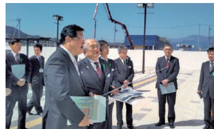
大船渡市において、戸田市長からBRT(バス高速輸送システム)大船渡駅周辺地区の土地区画整理事業等の説明を受ける。