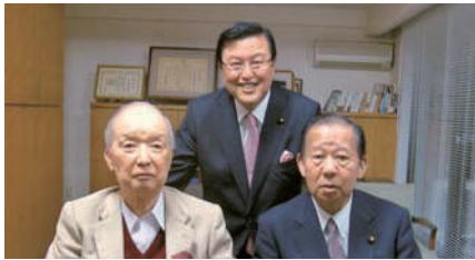
海部俊樹元総理、二階俊博幹事長と。