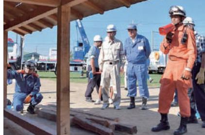
愛西市総合防災訓練で日永市長と。