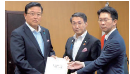
「拉致問題の完全解決について」平井鳥取県知事、伊木米子市長から要望を受ける。