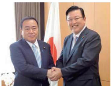
梶山内閣府特命担当大臣(地方創生・規制改革担当)と。