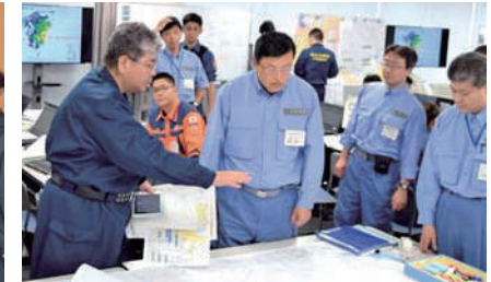
南海トラフ地震の際の中部緊急災害現地对策本部運営訓練に本部長として参加。