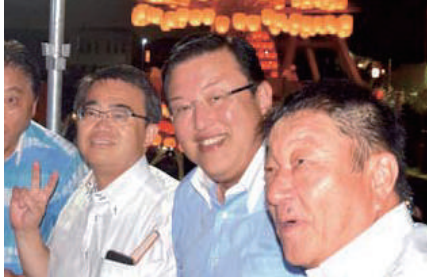
ユネスコ無形文化遺産に登録された蟹江町の須成祭で大村知事、横江蟹江町長と。