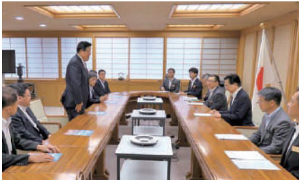
岩手県の達増知事へ復興大臣政務官留任の挨拶を行い、岩手県における復興の現状と課題について意見交換。