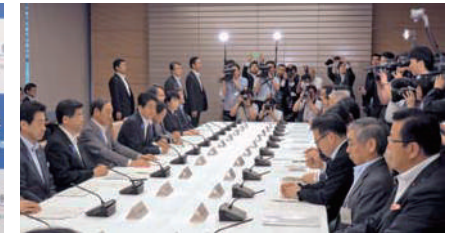
首相官邸での月例経済報告等に関する関係閣僚会議に出席。