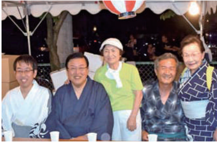
愛西市の盆踊り大会で横井県議、日永市長と。