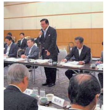
県連での意見交換会