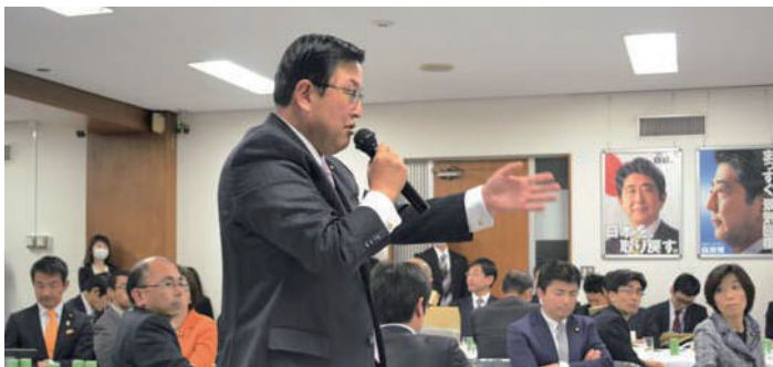
党本部での部会、調査会で中小企業の振興、TPP、農協改革など地元の声を力強く発信する