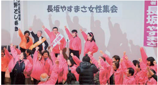
長坂やすまさ女性集会で(安倍昭恵夫人が駆けつける)