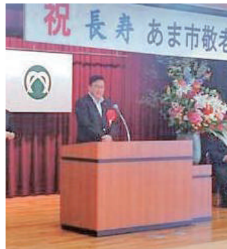
各地の敬老会でご長寿をお祝いする