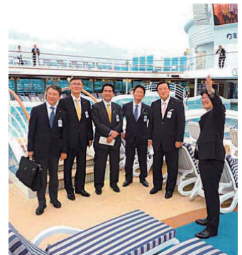
世界から観光客を呼びこもう!クルーズ船の視察