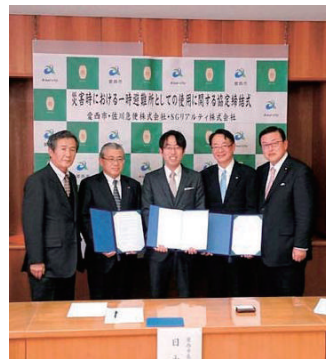
防災協定を民間事業者と結び橋渡しを務める