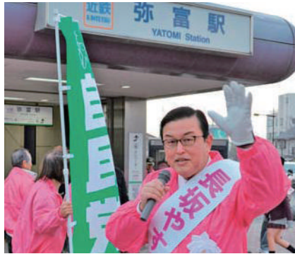
朝は選挙区内の各駅で街頭演説

昨年末の解散総選挙は与党議員の私としても突然の解散であり、衆議院の厳しさを痛感し、準備不足を乗り越え、同志県議の皆さんを始め市町村長さん、市町村議会の同志の皆様や支援者の皆様の力強いご奮闘のおかげで引き続き小選挙区で当選をさせて頂きました。心から感謝申し上げます。皆様から頂いた一票一票の重みを噛みしめ、災害に強い地域づくりに精励し、地方創生の推進、皆様が実感できる景気回復を実現するため一層努力する決意です。