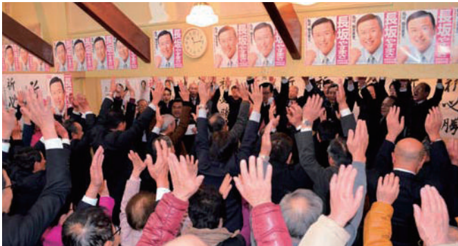
支持者の皆さんと当選のハンザイ