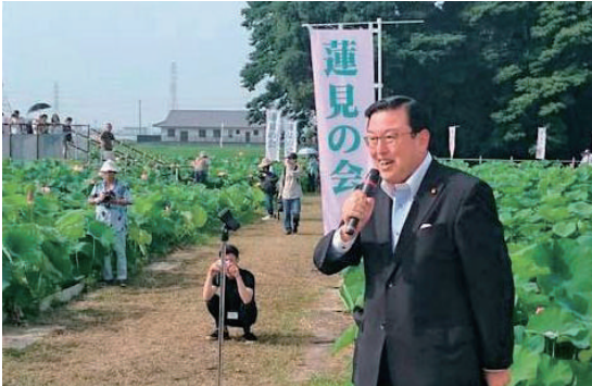
愛西市の蓮見の会