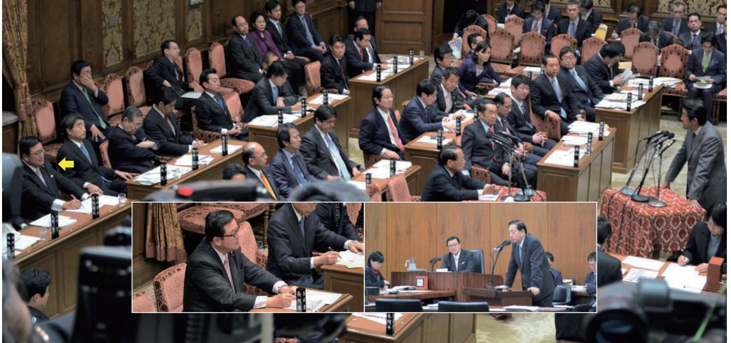
上:予算委員会で答弁する安倍首相。 委員席の長坂やすまさ代議士。(委員席次はアイウエオ順)