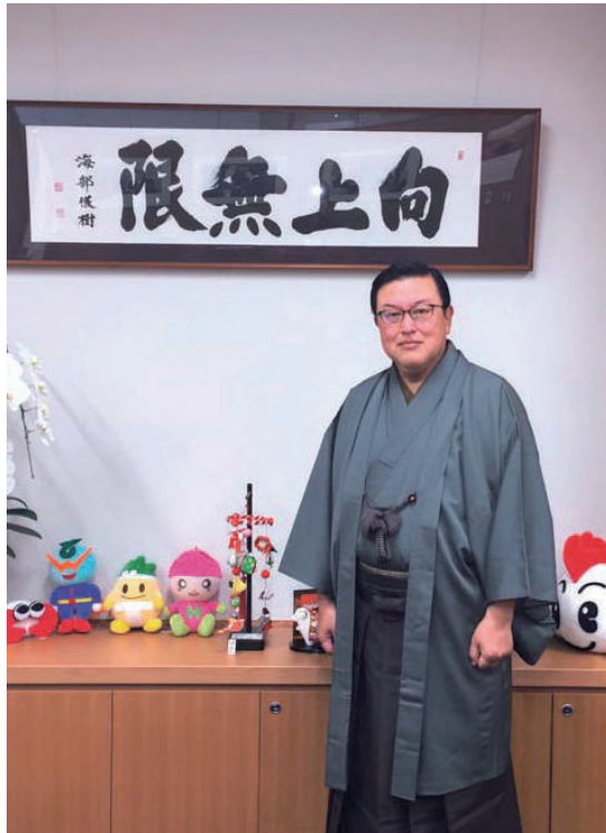
通常国会初日は和装議連の一員として和服姿で党院(国会事務所で)