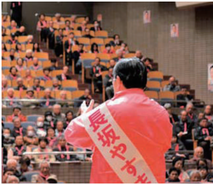
連日連夜の演説会で訴える