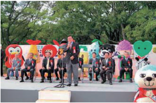
稲沢市祖父江のサンドフェスタで

国会は平和安全法制はじめ難問山積で、150日間の国会をさらに95日延長し、夏休み返上で九月末まで頑張ります。その中で国会活動、地元要望はもとより地元での街おこし行事に参加させて頂き、更にエネルギーに邁進します。