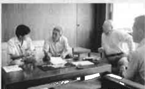
H26.7.8(火) 宮田総代から公園等の要望についての相談を受ける