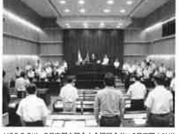
H26.9.3(火) 9月定例会市議会本会議開会式に8月豪雨土砂災 害で亡くなった人達に対して「黙祷」の発議をする(かまだ)。