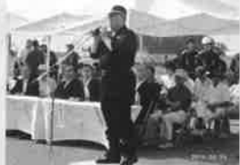
H26.6.29(日) 蒲郡消防団水防訓練