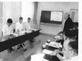
H26.8.4(月) 「蒲郡自由クラブ」の 「東三河建設事務所・三河港務所要望会」