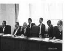
H26.7.17(木) 国道23号蒲郡バイパス建設 促進協議会要望会(中部地方整備局)