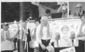
H26.8.3(日) いかだレース・ハズストーンカップの開会式にて