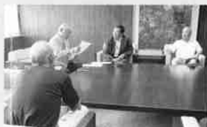
H26.9.10(木) 「三谷区会館建設」について池田上区総代並びに地区代表から補助金の相談を受ける