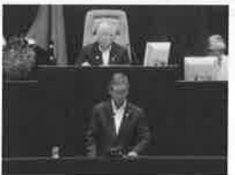
H26.9.3(火) 9月定例会市議会 招集の挨拶

※蒲郡市議会9月定例会が9月3日(火)午前10時に開会されました。初日は、開会前に副議長が発言で、「市民憲章」を参事全員で唱和を致します。それに続いて、「かまだ」が議長発言として、8月に全国各地で起きた土砂災害等で亡くなった方々のご冥福を祈念して「黙祷」を致しました。 その後、9月定例会市議会の開会を「かまだ」が宣言をして、市長の「9月定例会招集の挨拶」(会議録を議員の手に指す)「監査委員の現金出納検査」等諸般の報告の後、提出議案の説明を各課からして貰いました。その後、一般質問等を行いました。