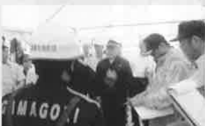
H26.8.9(土) 第59回愛知県消防団操法大会出場の第2分団に激励の挨拶