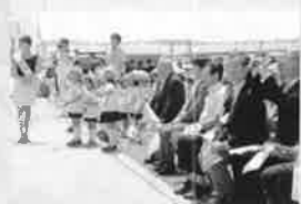
H26.7.16(水) 海王丸入港歓迎式