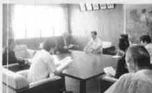
H26.9.11(木) 吉見市P連会長・高橋校長会長等からH27年度予算要望の説明を受ける。