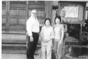
H26.7.25(金) 小田原市・福蔵寺の本堂前