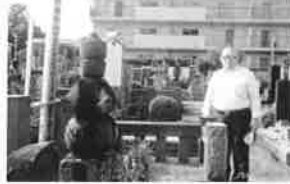
H26.7.25(金) 天桂院殿の墓前