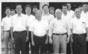
H26.8.6(水) 「蒲郡自由クラブ」の浜岡原子力発電所見学会