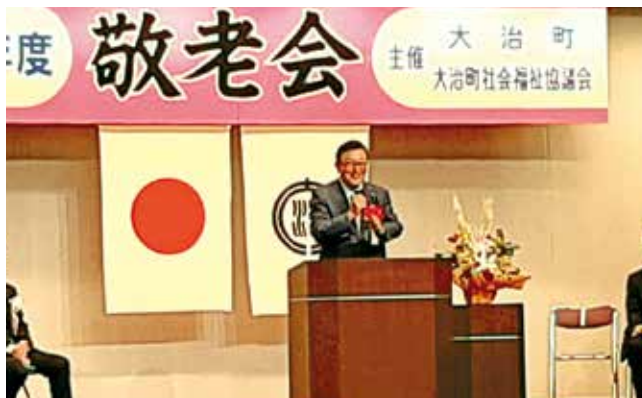
地元の敬老会に出席させていただきました。