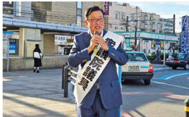
稲沢市の国府宮駅で朝の街頭活動をしました。