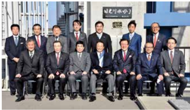
麻生太郎自民党副総裁(当時)と9区の同志県議、首長で日光川新水閘門を視察。