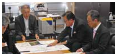
国土交通省の山本道路局長に一宮西港道路の重要性を説明。