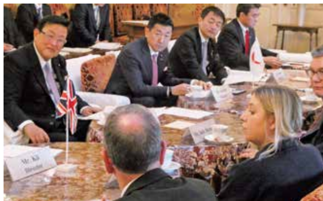
英国議会の運輸特別委員会のメンバーと意見交換。