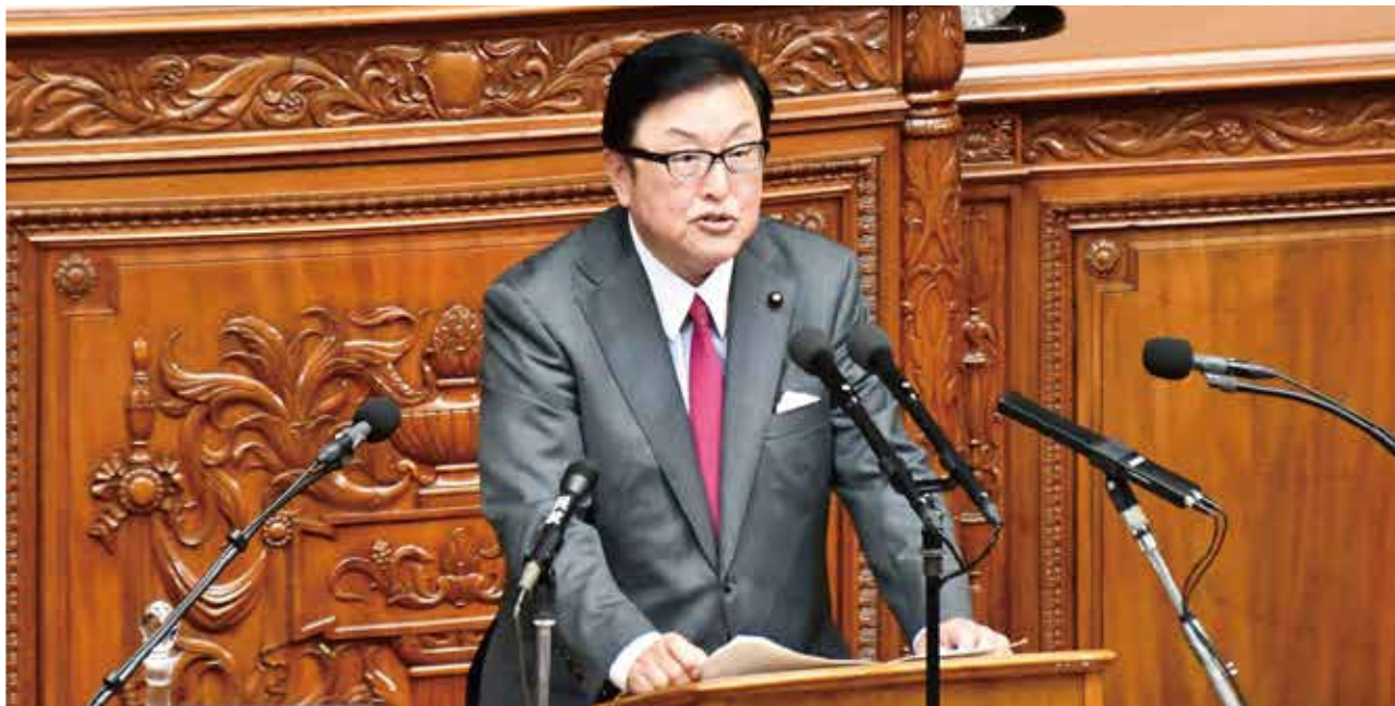
衆議院本会議に登壇し委員長報告する長坂やすまさ国土交通委員長。