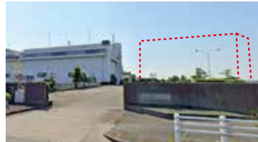
新排水機場増設のイメージ

日光川河口の排水機場の整備 日光川流域は、日光川河口のポンプ排水に頼らざるを得ない地域であり、東洋一の能力の排水機場が2棟稼働して地域を守ります。水災害の激甚化に対応したさらなる安全度の向上のため、日光川河口に新たな排水機場の増設を強力に要望し推進します。