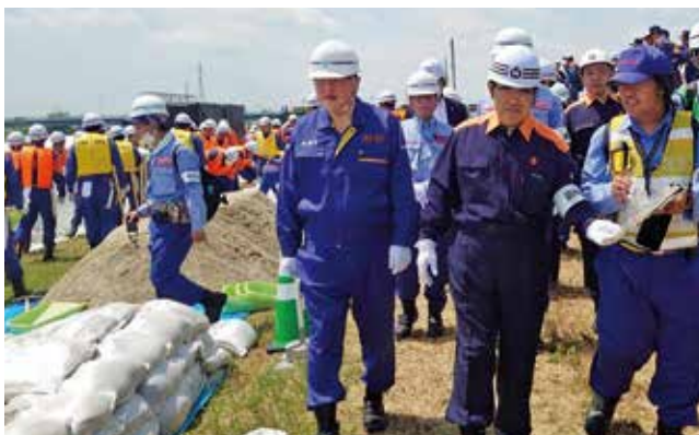
木曾三川連合総合水防演習に参加。大村知事と。