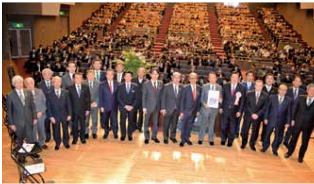
一宮西港道路や地元の防災減災対策を地元公職者の皆さんと麻生太郎自民党副総裁(当時)に要請する。