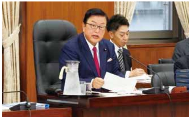
衆議院国土交通委員会で委員長を務める。