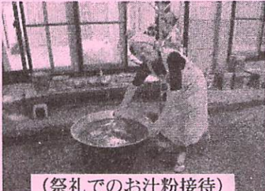
(祭礼でのお汁粉接待)

プ役を果たしていましたが、西尾市ではそれが全て議員に委ねられております。これは旧幡豆郡の方式の方がいいように思えます。 防災については、あの大震災の教訓を